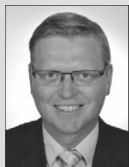
MVDr. Pavel BĚLOBRÁDEK, Ph.D., MPA vicepremiér, předseda KDU-ČSL Náchod, KDU-ČSL